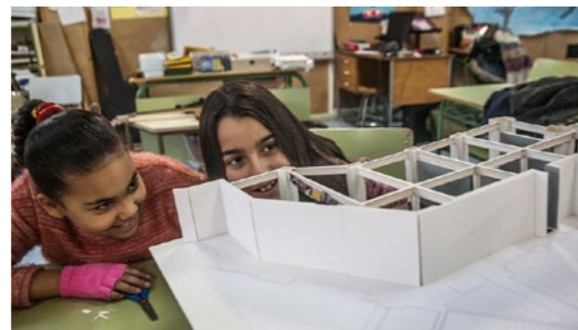
Creemos por momentos. Proyecto CoCo 2017 - 2018.

Este año colaboraremos con los alumnos de primaria del CEIP San Miguel (barrio de la UVA, distrito de Hortaleza). Además, iniciamos una línea de cooperación con un colectivo de adultos. En ambos casos, CoCo mantiene dos ejes de trabajo: una labor directa en y sobre el contexto en el que se desarrolla (barrio, familia, aula...) y, además, un trabajo de expansión de la mirada crítica de los co-comisarios/as para poner en valor su capacidad de influencia más allá de su entorno habitual (CentroCentro y alrededores, redes...).