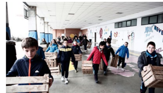
Levadura 2018. Completando territorio

Este año proponemos desde CentroCentro una residencia para un creador/a en el ámbito de las prácticas vinculadas con la construcción y la transmisión de narrativas (e imaginarios) a través de la oralidad. Mediante esta temática y las prácticas que de ella puedan derivarse, deseamos incidir en la redefinición del estudiante-responsable y crítico a lo largo de cada una de las etapas del proceso- como agente activo en su propia educación. El proyecto seleccionado se desarrollará en un centro de primaria, desde el 22 de abril al 19 de mayo de 2019.