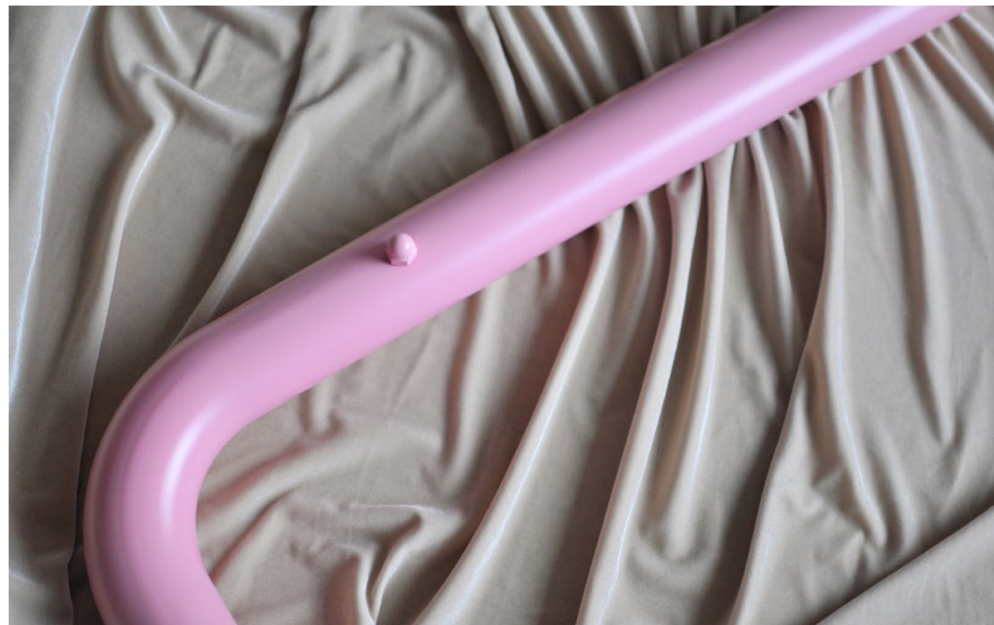
Lúa Coderch, TGWINDOHM (en rosa) , 2018. Escultura, acero inoxidable, 70 x 170 x 80 cm.

Lúa Coderch combina las prácticas narrativas y las prácticas objetuales en vídeos, performances e instalaciones que configura como dispositivos de investigación. El valor económico y el carisma, la relación entre cuerpo y voz, el deseo de creer o el relato del instante memorable, son