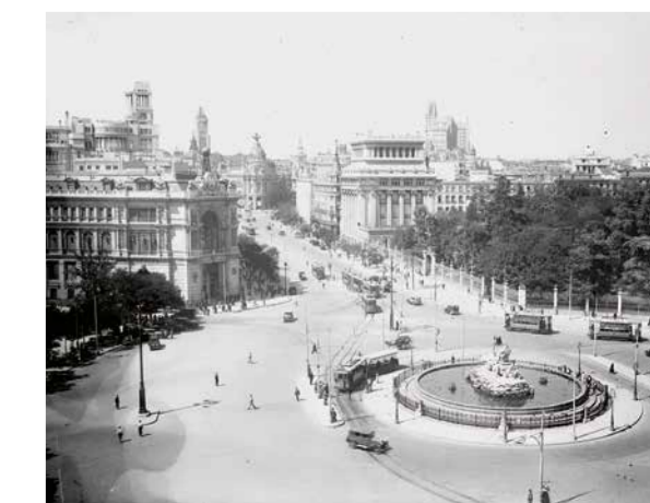
MUSEO DE HISTORIA DE MADRID

View taken in the 1930s from the central tower where the Observation Deck of CentroCentro is located today.