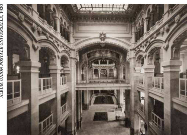
ALBUM UNION POSTALE UNIVERSELLE, 1909

Los principales servicios de atención al público —correos, telégrafos y teléfonos— se agrupaban en el gran hall .