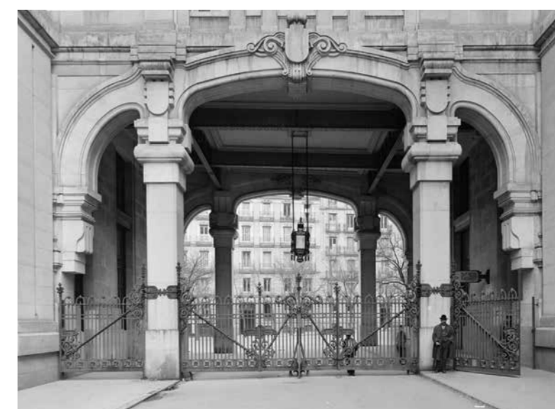
El pasaje de Alarcón hacia 1920.

A series of stories complete the exhibition: The Cibeles and the Palace, inseparable partners; Towards 20th Century Madrid; The Structure of the Tower; and The Palazuelo House . Finally, a selection of photographs of Antonio Palacios' work in Madrid, taken by Luis Lladó Fábregas between 1918 and 1935, is exhibited.